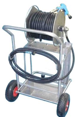
Robot de lavage